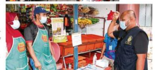
(Below) MPAJ officers conducting checks at neighbourhood shops on compliance of Covid-19 SOP.