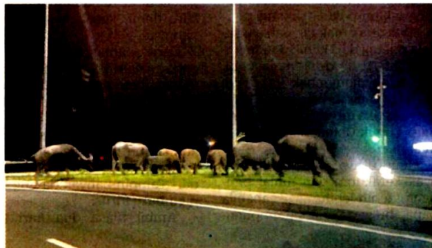
KERBAU-KERBAU yang berkeliaran di kawasan jalan raya yang menimbulkan rasa tidak senang orang ramai di Cyberjaya.

“Tindakan penguatkuasaan boleh dibuat di bawah Seksyen 5(1) Enakmen Mengawal Lembu/Kerbau 1971, yang mana kesalahan ini boleh dikompaukan dan binatang ini boleh ditangkap dan disita.