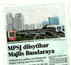
Keratan akhbar BH semalam.

Pada masa terdekat, katanya MBSJ akan meneruskan perancangan pembangunan termasuk pembinaan kompleks sukan baharu dengan kemudahan gelanggang futsal yang mengikut spesifikasi Persekutuan Bola Sepak Antarabangsa (FIFA), pembinaan jambatan antaranya di Persiaran Kewajipan dan beberapa lagi pembangunan infrastruktur lain, selain mendapatkan maklum balas penduduk mengenai senarai projek yang perlu diutamakan.