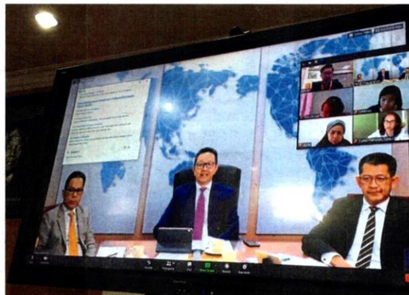
Teng (centre) conducting a live press conference after launching the Selangor International Business Summit 2020.

Selangor inspires new ways to engage with global players at four-day event