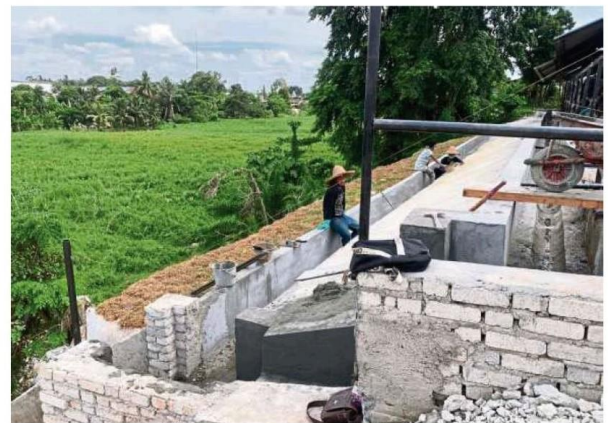
Slope reinforcement and drainage upgrading work were carried out behind the Batu Arang wet market and MPS food court.

"Now we are happy the community and traders can safely utilise the space provided," Chua added.