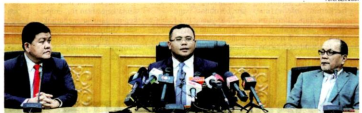
Amirudin (tengah) ketika sidang akhbar berkaitan perkembangan isu air di Selangor di Bangunan Sultan Salehuddin Abdul Aziz Shah semalam.

berpendapat kos bagi pemberian subsidi itu adalah lebih wajar dibelanjakan untuk pelaksanaan penambahbaikan pengurusan air di Selangor.