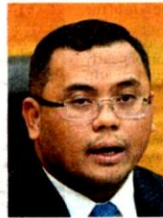
Datuk Seri Amirudin Shari

"The amount (RM4 million) should be used to add more officers who can detect pollution at