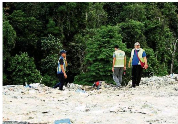
MPKj officers inspecting an illegal dumpsite in Bukit Enggang.

"But one of the four affected landowners appealed, saying that