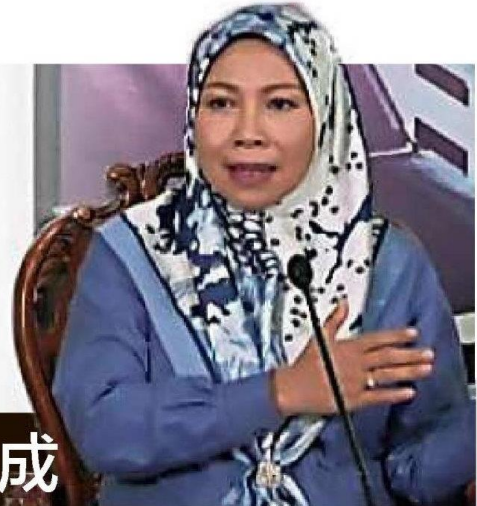
调涨门牌税,但会进行产业重新估价工作。诺莱妮宣布,梳邦再也市政厅今年不会

“产业重新估价工作预计明年完成。无论如何,市政厅调涨门牌税必须获得州政府同意,涨幅预计不超过20%。”