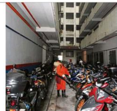
Common spaces and high-rise touch points at the Desa Lembah Permai Flats in Ampang being sanitised by MPAJ personnel after one resident tested positive for Covid-19.