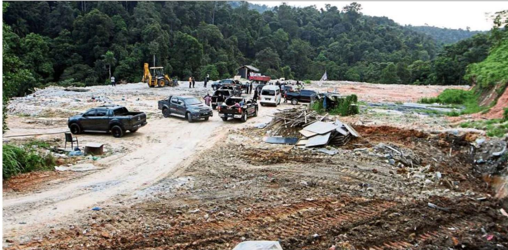
Rubbish and construction waste have been found dumped on a vacant land in Sungai Long, Kajang.