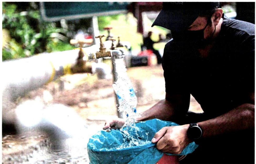
PENCEMARAN terbaharu menyebabkan penutupan empat loji iaitu LRA Sungai Selangor Fasa 1, 2, 3 dan Rantau Panjang.

gas apabila kadar bau juga dikesan pada paras tiga ton. Siasatan mendapati bau dikesan berakhir di alur air Sungai Gong, Rawang yang