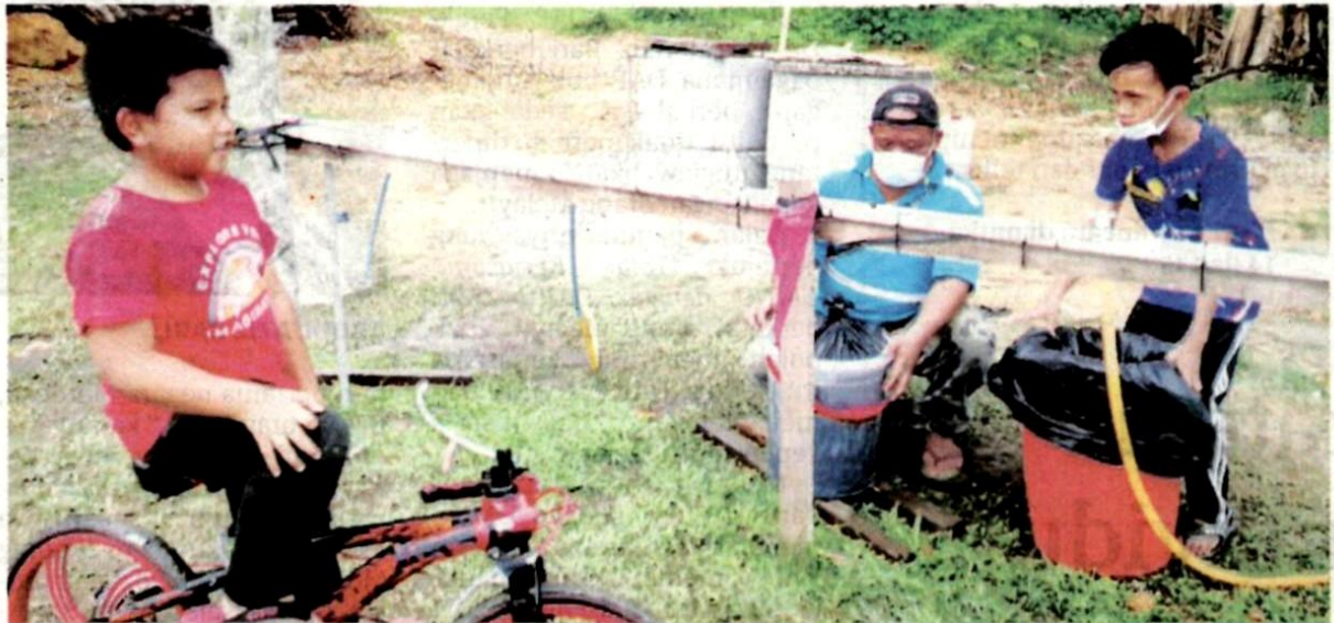
SEORANG penduduk bersama anaknya mengambil air di Telaga Rakyat Anak Jati Jalan Kebun, Klang semalam.