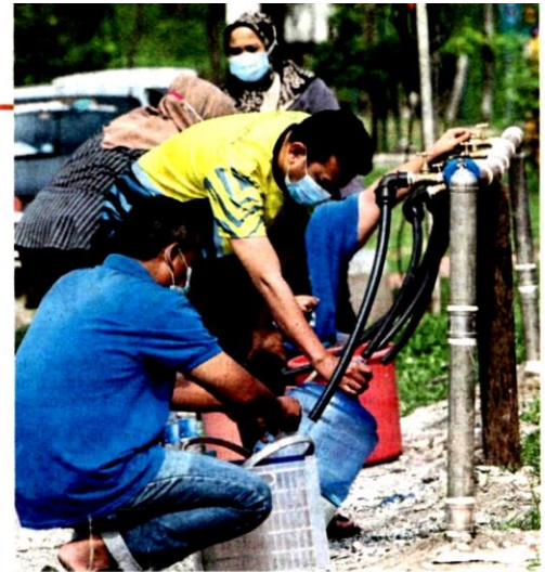
Taman Greenwood residents in Gombak getting water supply from public water taps in the area last Monday.

the early stage or before it enters the treatment plants," he said.